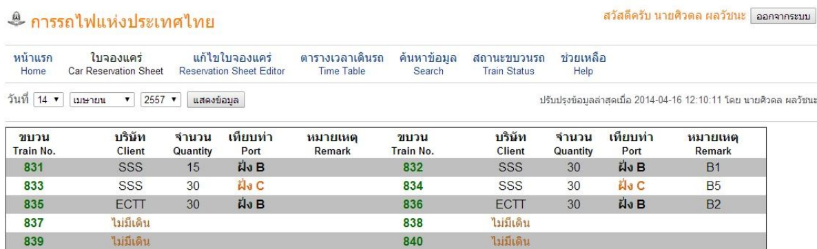
รูปที่ 2 หน้าจอเมื่อเข้าสู่ระบบแล้ว

การออกจากระบบ ให้คลิกที่ปุ่ม “ออกจากระบบ” ซึ่งปรากฏขึ้นมาแทนปุ่ม “เข้าสู่ระบบ” เมื่อทำการเข้าสู่ระบบสำเร็จ เมนูจะกลับไปเป็นเมนูที่เหมาะสมสำหรับผู้ใช้งานทั่วไปทันที